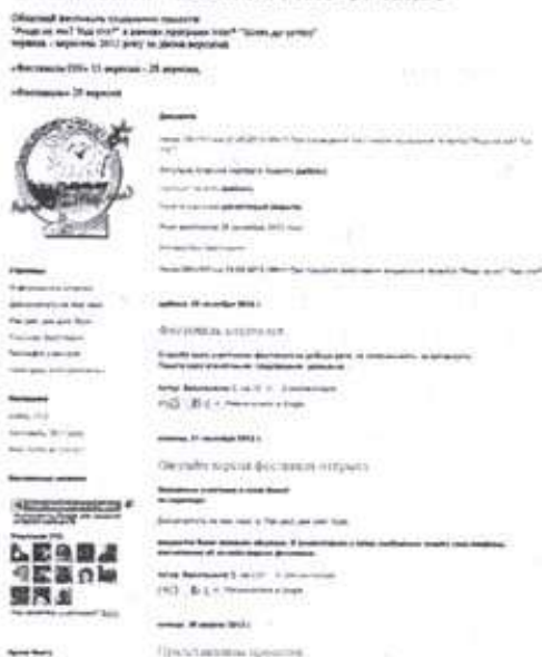
Рис. 2. Блог другого фестивалю «Якщо не ми? Тоді хто?»