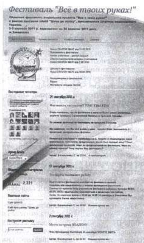
Рис. 1. Блог першого фестивалю «Все в твоїх руках!»

екти, 12 команд були представлені на фестивалі 24 вересня. Все, що відбувалось в рамках першого фестивалю відображалось на блозі фестивалю http://festifalzp2011.blogspot.com/ (рис. 1).