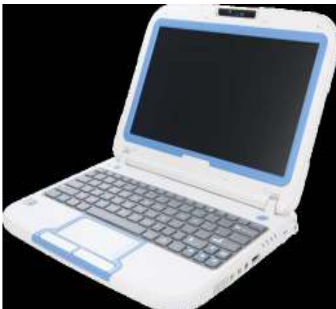
Специализированный нетбук PC Classmate: модель Impression 100 ES